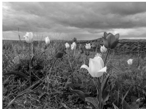
А. _____ Б. _____