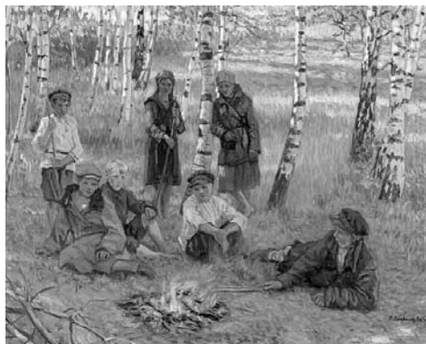
Н.П. Богданов-Бельский «У костра» Рис. 2