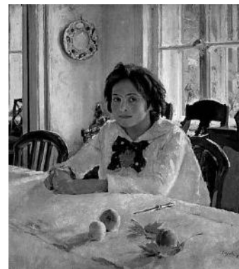
В.А. Серов «Девочка с персиками» Рис. 3

Протекание химической реакции изображено на рисунке: