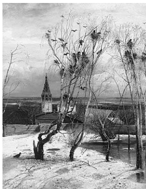
А.К. Саврасов «Грачи прилетели» Рис. 1

2.1. Из представленных ниже репродукций картин выдающихся русских художников выберите ту, на которой изображено протекание химической реакции.