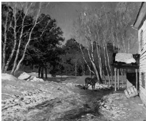
И.И. Левитан «Март»