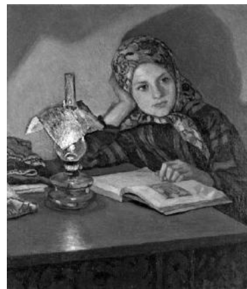
Н.П. Богданов-Бельский «Вдохновение»