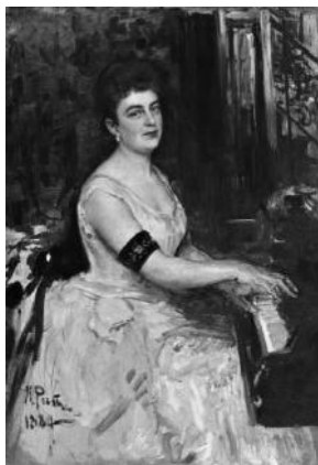
И.Е. Репин «Портрет пианистки М.К. Бенуа»

2.1. Из представленных ниже репродукций картин выдающихся русских художников выберите ту, на которой изображено протекание химической реакции.