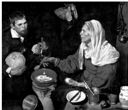
«Старуха, жарящая яичницу»