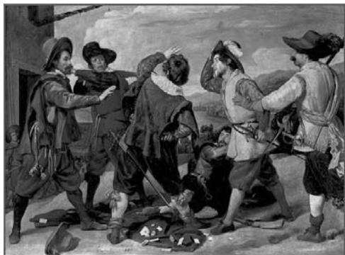
«Ссора солдат перед посольством Испании»

2.1. Из представленных ниже репродукций картин выдающегося испанского художника Диего Веласкеса (1599 – 1660) выберите ту, на которой изображено протекание химической реакции.