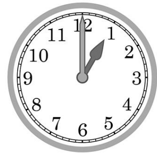
Алжир 20 августа 13:00