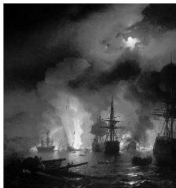
И.К. Айвазовский «Чесменский бой» Рис. 2