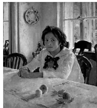
В.А. Серов «Девочка с персиками» Рис. 3

Протекание химической реакции изображено на рисунке: