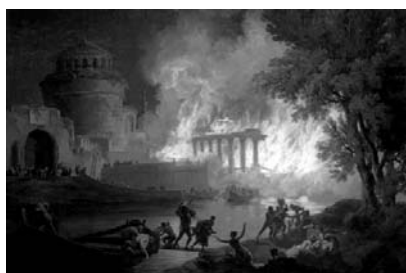
П.-Ж. Волер «Пожар в Риме» Рис. 1

2.1. Из представленных ниже репродукций картин выдающихся мировых художников выберите ту, на которой изображено протекание химической реакции.