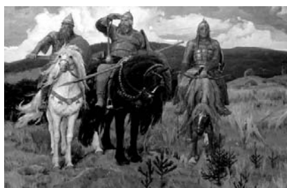
В.М. Васнецов «Три богатыря» Рис. 2