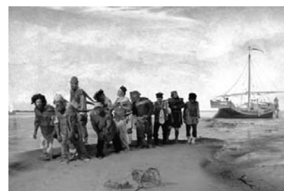
И.Е. Репин «Бурлаки на Волге» Рис. 3

Протекание химической реакции изображено на рисунке: