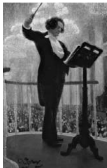
«Портрет А.Г. Рубинштейна» Рис. 1

2.1. Из представленных ниже репродукций картин выдающегося русского художника И.Е. Репина (1844 – 1930) выберите ту, на которой изображено протекание химической реакции.