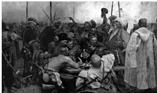
«Запорожцы пишут письмо турецкому султану» Рис. 2