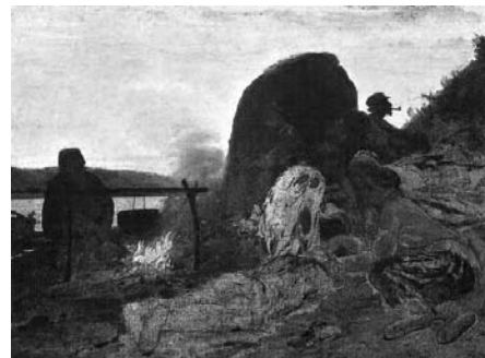
«Бурлаки у костра» Рис. 3

Протекание химической реакции изображено на рисунке: