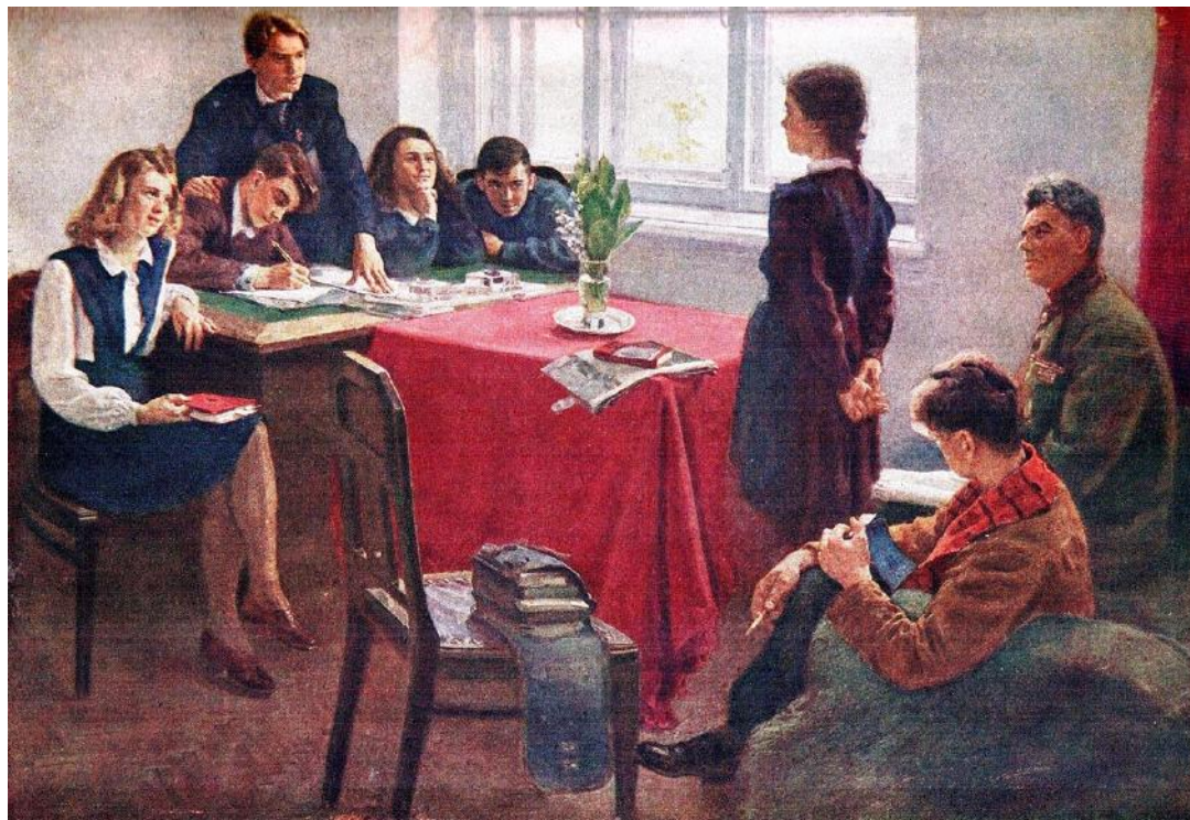
С.А. Григорьев. Прием в комсомол (1949).

2. Какие утверждения следуют из информации, содержащейся в изображении?