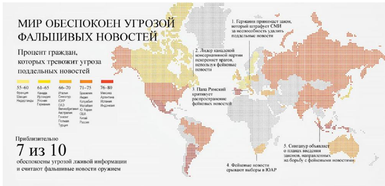
Рис. 1. Распределение стран и административных единиц в мире по степени угрозы фальшивых новостей, 2018 г.

6-12. Ознакомьтесь с материалами и выполните задания.