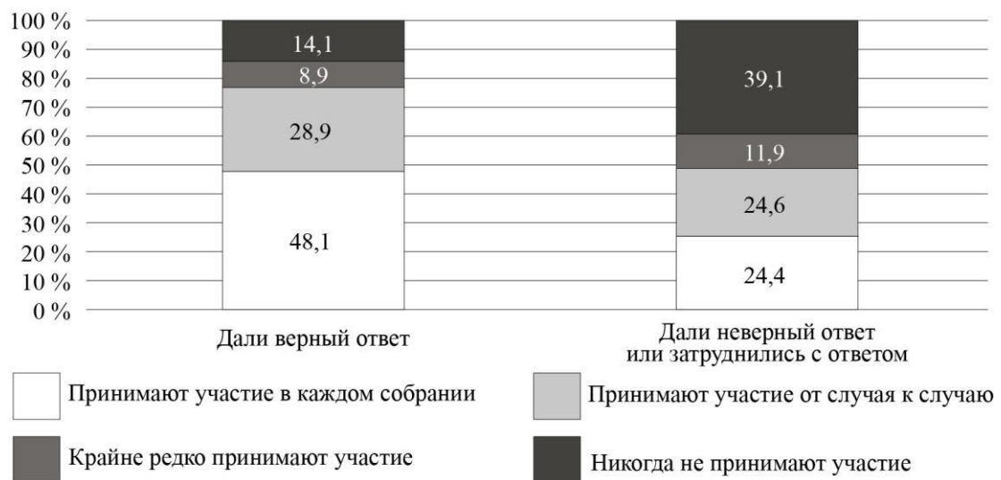
Рис. 5. Дифференциация участия собственников в ОС по знанию органа управления МКД (%)