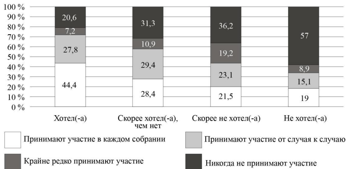
Рис. 7. Дифференциация участия собственников в ОС по желанию иметь квартиру в конкретном МКД (%)