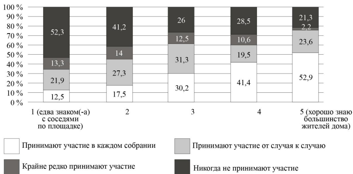
Рис. 2. Дифференциация участия собственников в ОС по степени знакомства с соседями (%)