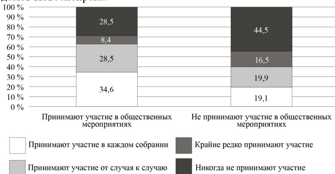
Рис. 1. Дифференциация участия собственников в ОС по участию в общественных мероприятиях (%)

Ниже представлены результаты интернет-опроса жителей многоквартирных домов Новосибирска.