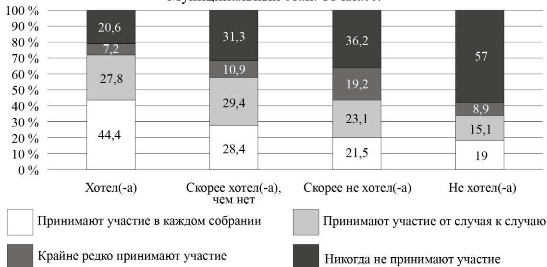
Рис. 7. Дифференциация участия собственников в ОС по желанию иметь квартиру в конкретном МКД (%)

6.1. На основании анализа диаграмм выберите верные утверждения о характеристиках регулярных участников ОС по сравнению с остальными жильцами МКД.