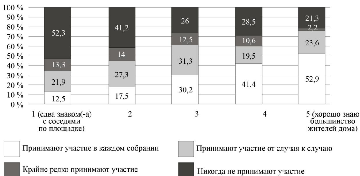
Рис. 2. Дифференциация участия собственников в ОС по степени знакомства с соседями (%)