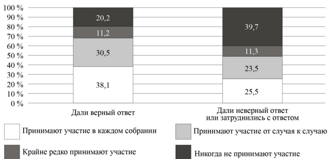
Рис. 6. Дифференциация участия собственников в ОС по знанию состава общего имущества в МКД (%)