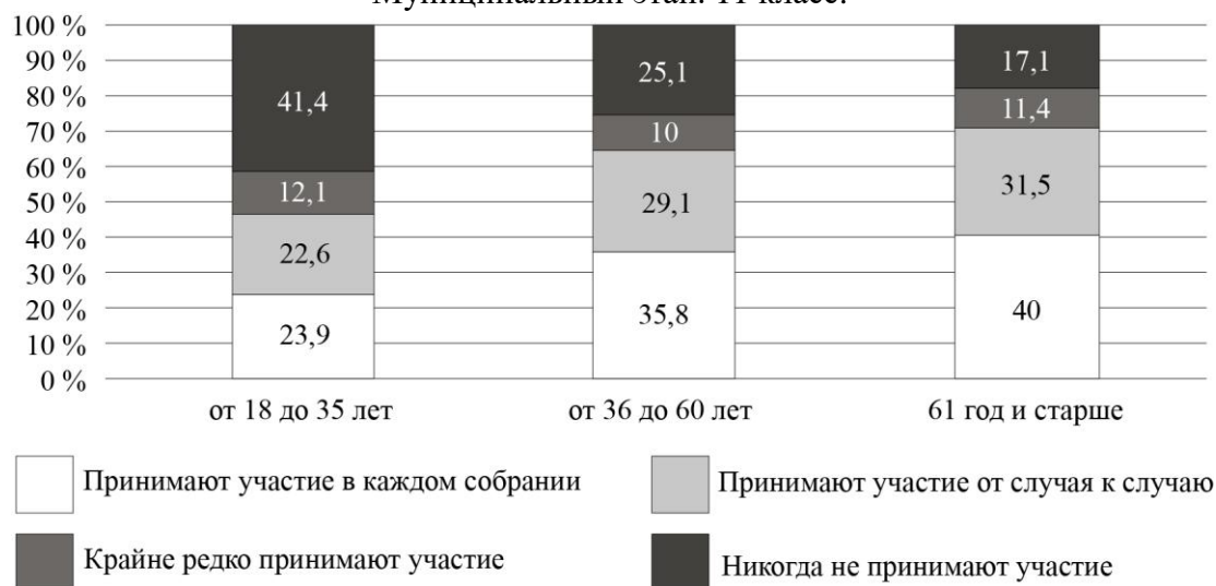
Рис. 3. Дифференциация участия собственников в ОС по возрасту (%)