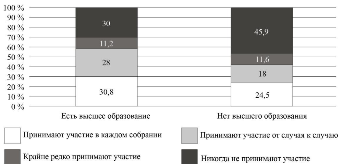
Рис. 4. Дифференциация участия собственников в ОС по образованию (%)