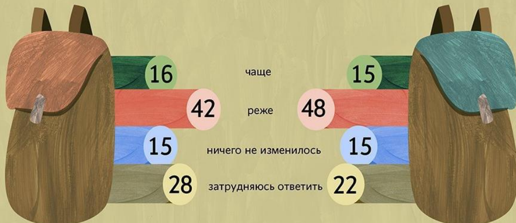
Население в целом