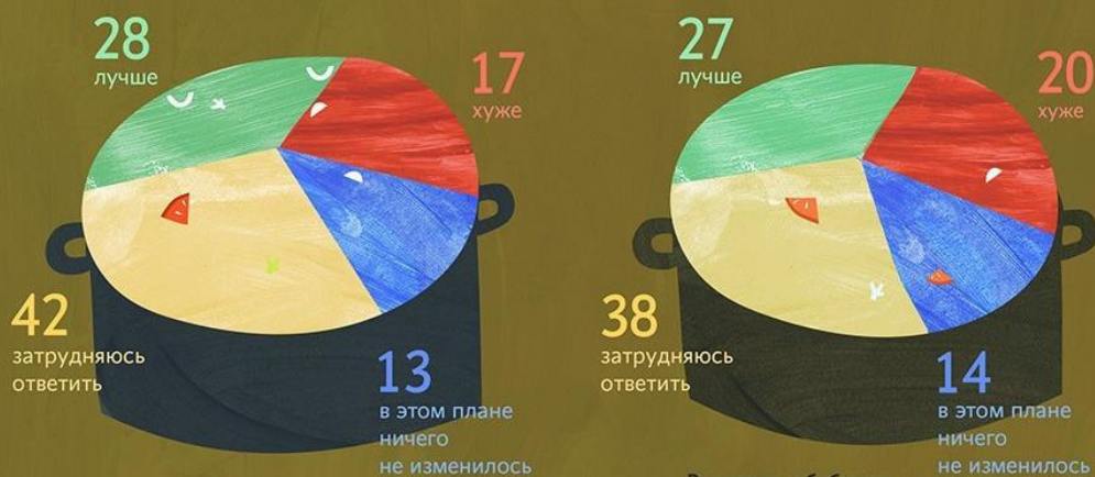
Население в целом